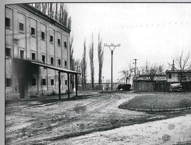
V budově sýpky byla v minulosti i koželužna. V pozadí je už postavené městské koupaliště