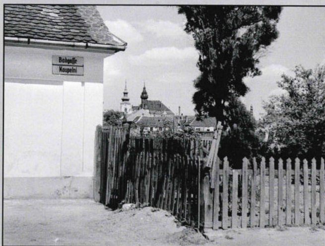
Dvojjazyčné pojmenování ulice Koupelní v období okupace

Většina staré zástavby této ulice byla v sedmdesátých letech zbourána. Byly zde postaveny dva velké kancelářské objekty, patřící tehdy cihelnám a dolům, byla zde vybudována i mateřská školka. Podniky skončily, většina kanceláří je dnes prázdných, ve školce už také děti nejsou. Ze sýpky vybudovaná ubytovna taky moc nepřekypuje životem. I Mlýnské rameno doznalo změn, zúžením toku po „Laguně“ není památky, padl i černý topol. Název ul. Koupelní má ale stále opodstatnění, je jednou ze dvou přístupových cest na městské koupaliště.