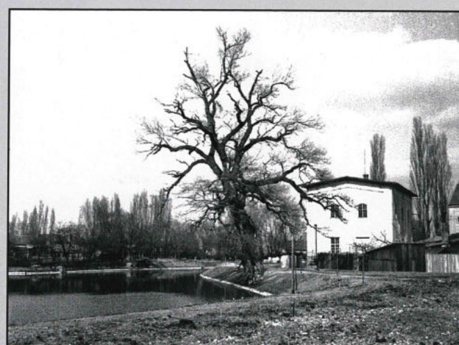
Artefakty historie: pozůstatky mlýnů a černý topol