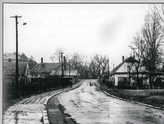
Vzhled ulice Koupelní v období krátce před poslední demolicí původní zástavby. Výjezd směrem k ulici Bratislavské a k někdejší tabákové továrně