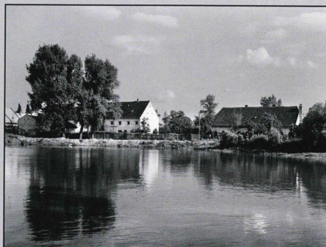
Název Laguna mělo toto místo jistě oprávněně