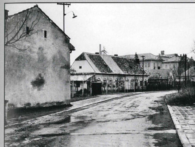
Ulice Koupelní okolo roku 1970, v pozadí budovy tabákové továrny