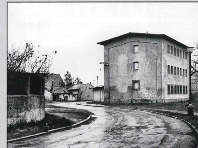
Budova archivu po přestavbě v období mezi lety 1962–1964