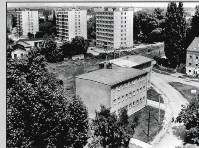
K bývalé strojovně mlýnů byl v letech 1973–1976 přistavěn depozitář Státního okresního archivu